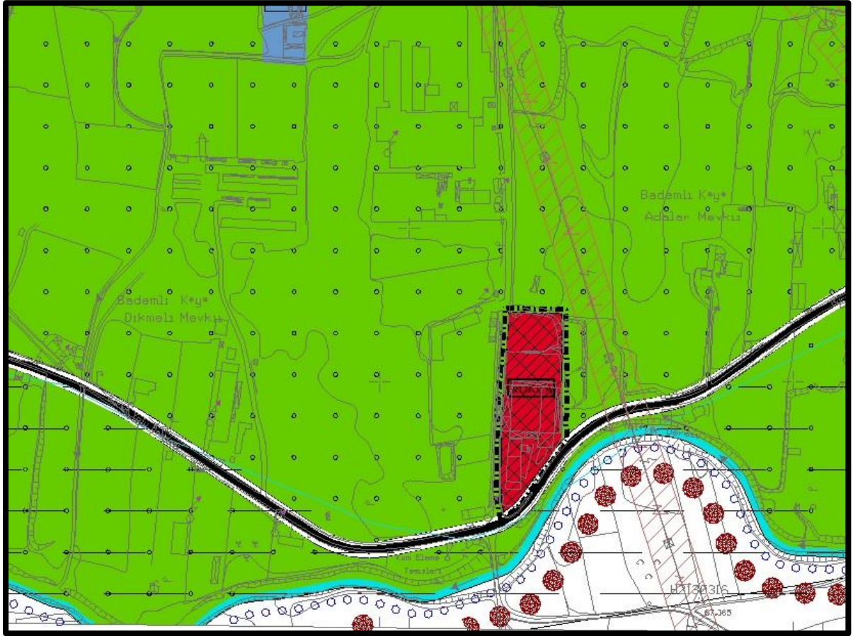
Şekil 5: 1214, 1215 ve 1216 numaralı parsellere ilişkin 1/5000 Ölçekli Nazım İmar Planı Tadilatı