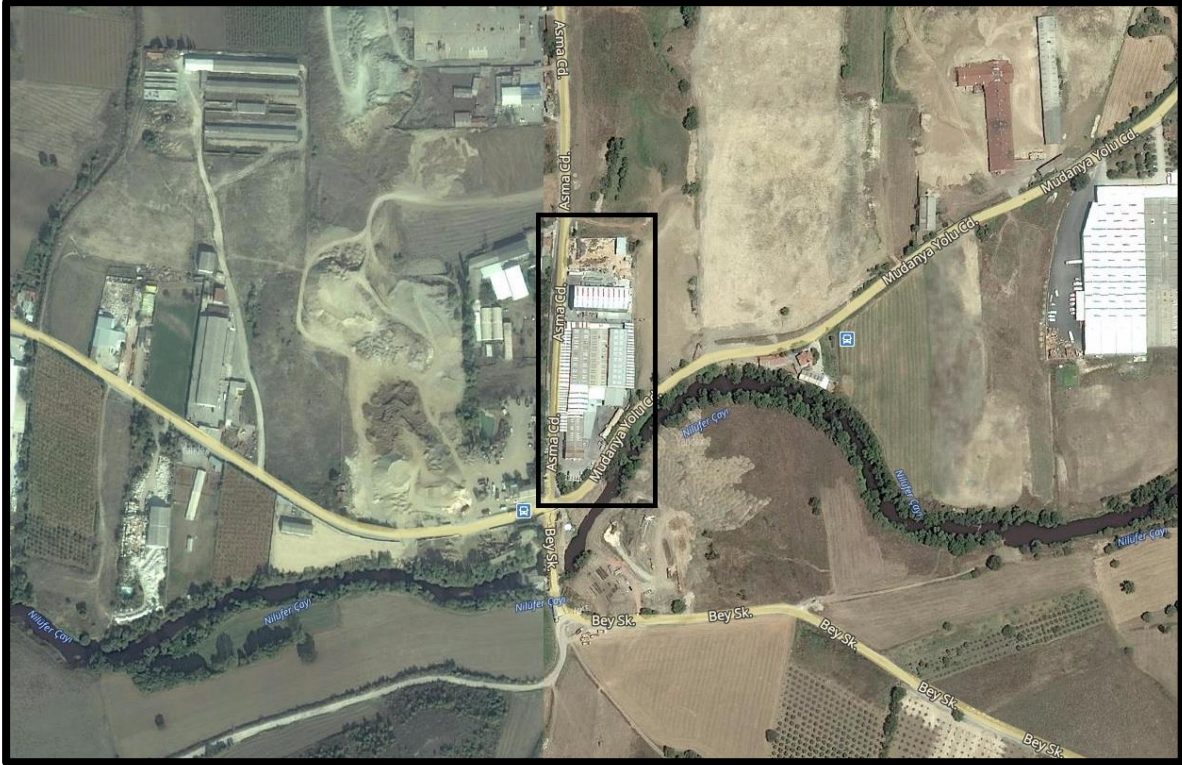
Şekil 2: Planlama Alanının Ulaşım İlişkileri