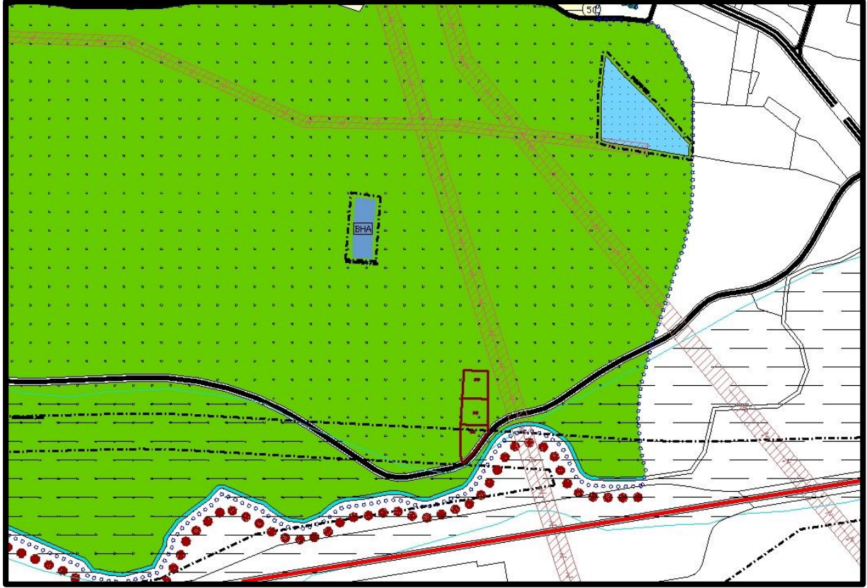
Şekil 4: 1/5000 ölçekli Nazım İmar Planı Durumu